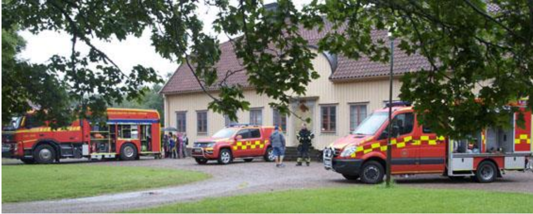
Ett mycket populärt inslag, var besöket från Räddningstjänsten